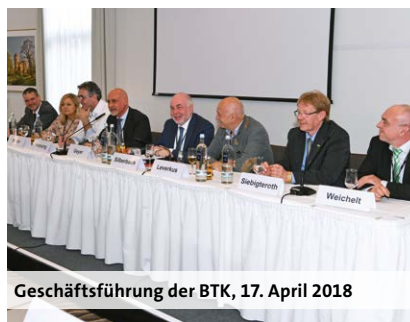
Geschäftsführung der BTK, 17. April 2018