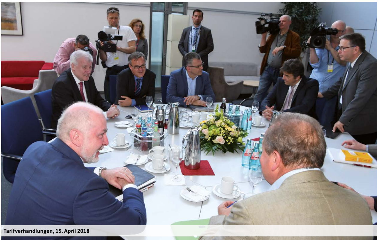
Tarifverhandlungen, 15. April 2018

Die Erhöhungen im Bereich der Fleischuntersuchung betragen ab dem 1. März 2018 3,19 Prozent, ab 1. April 2019 weitere 3,09 Prozent und ab 1. März 2020 1,06 Prozent.