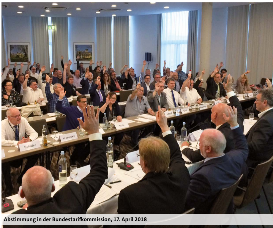
Abstimmung in der Bundestarifkommission, 17. April 2018

Pflege und TVPöD ab dem Urlaubsjahr 2018 bei einer 5-Tage-Woche von 29 auf 30 Arbeitstage erhöht. Die bisherige Übernahmeregung wird über die Mindestlaufzeit der Entgeltregelungen hinaus bis einschließlich Oktober 2020 vereinbart.