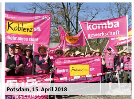
Potsdam, 15. April 2018

halten Beschäftigte der Entgeltgruppen 1 bis 7 mit Wirkung vom 1. März 2018 eine Einmalzahlung in Höhe von 250 Euro.