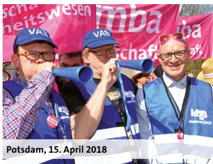
Potsdam, 15. April 2018