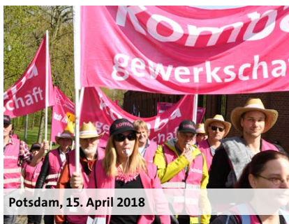
Potsdam, 15. April 2018