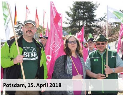
Potsdam, 15. April 2018