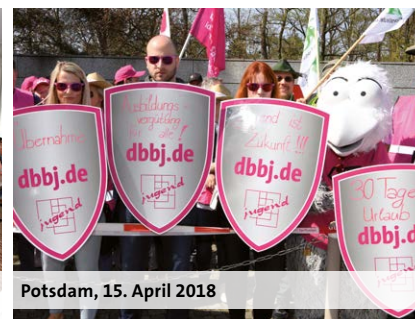
Potsdam, 15. April 2018