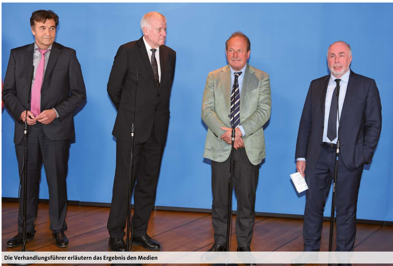
Die Verhandlungsführer erläutern das Ergebnis den Medien