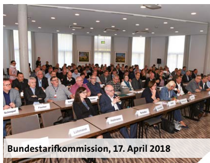
Bundestarifkommission, 17. April 2018