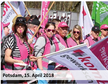
Potsdam, 15. April 2018